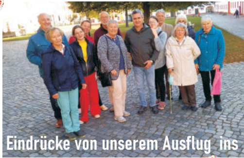
Eindrücke von unserem Ausflug ins Kloster Panschwitz-Kuckau

Bitte meldet Euch bei uns. Es funktioniert nur, wenn sich viele daran beteiligen. Am Ende gibt's wieder eine CD davon.