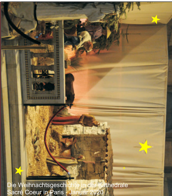
Die Weihnachtsgeschichte in der Kathedrale Sacré Coeur in Paris - Januar 2020

WEIHNACHTEN FÄLLT NICHT AUS! LIEBE FÄLLT NICHT AUS! HOFFNUNG FÄLLT NICHT AUS! LICHT IM DUNKEL FÄLLT NICHT AUS! "GOTT MIT UNS FÄLLT" NICHT AUS TEXT: GERHARD JUNG