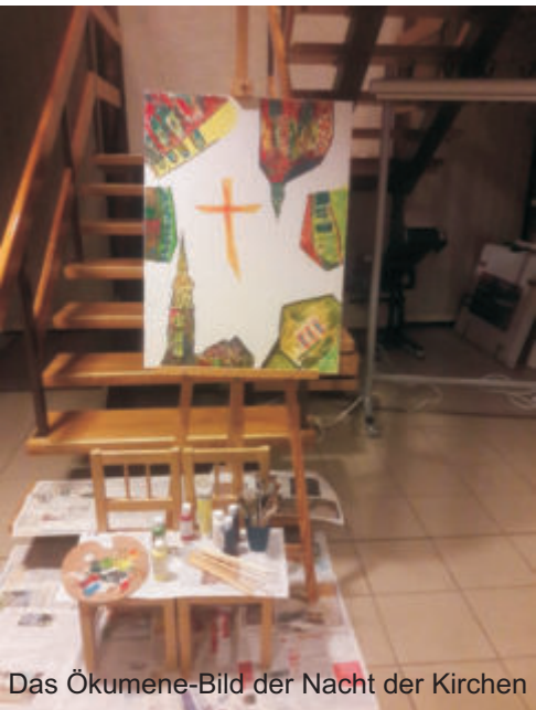
Das Ökumene-Bild der Nacht der Kirchen

Der Samurai machte sich auf den Rückweg und gelangte spät in der Nacht zu seinem Haus. Er schlich sich hinein, um seine Gemahlin nicht zu wecken. Doch als er die Schlafzimmertüre öffnete, sah er zu seinem großem Schock zwei Personen unter der Bettdecke: seine Frau und einen Fremden in Samurai-Kleidung. In einer Welle der Eifersucht zog er sein Schwert, um beide zu töten. Doch plötzlich hallte der Satz des Bauern in seinem Kopfe wider: "Töte nicht im Affekt!". Er steckte das Schwert zurück, nahm einen tiefen Atemzug und machte sodann absichtlich ein lautes Geräusch. Seine Frau wachte sofort auf, ebenso wie <der Fremde> an ihrer Seite. Dieser war jedoch kein Fremder, sondern - seine Mutter! "Was hat das zu bedeuten?" rief er entsetzt aus. "Ich hätte euch beinahe beide getötet!" "Wir hatten schreckliche Angst vor Einbrechern", berichteten die Frauen. "Deshalb haben wir deine Mutter in dein Samurai-Gewand gekleidet, um etwaige Eindringlinge zu erschrecken." Ein Jahr verging und der Bauer kam zum Samurai, um ihm sein Geld zurückzahlen. Doch dieser sprach: "Behalte dein Geld. Du hast mir deine Schulden bereits vor langer Zeit zurückbezahlt."